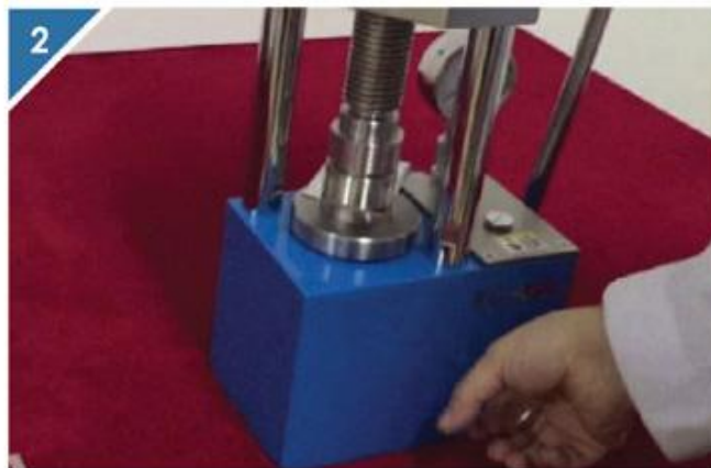
2 顺时针拧紧压片机放油阀