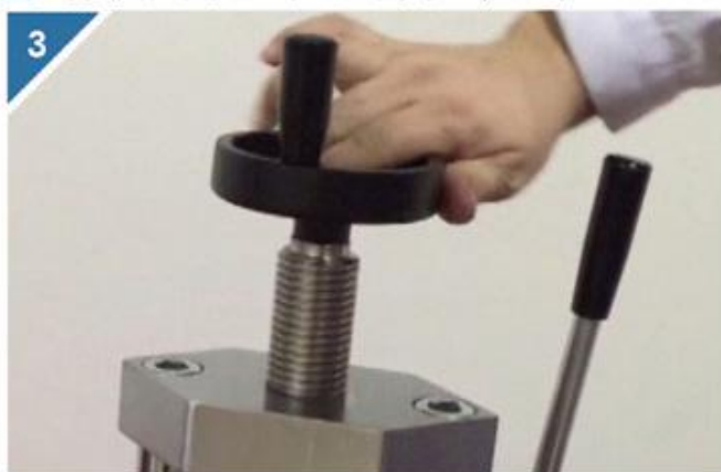
3 旋紧丝杠将模具固定住