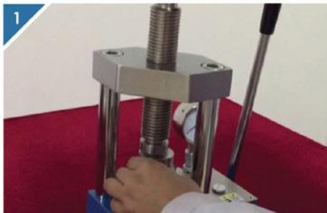
1 将模具放置在压片机中心位置