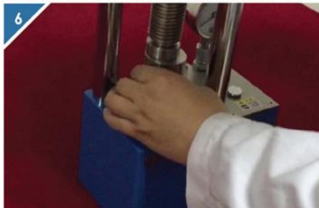
6 从压片机中取出压好的模具