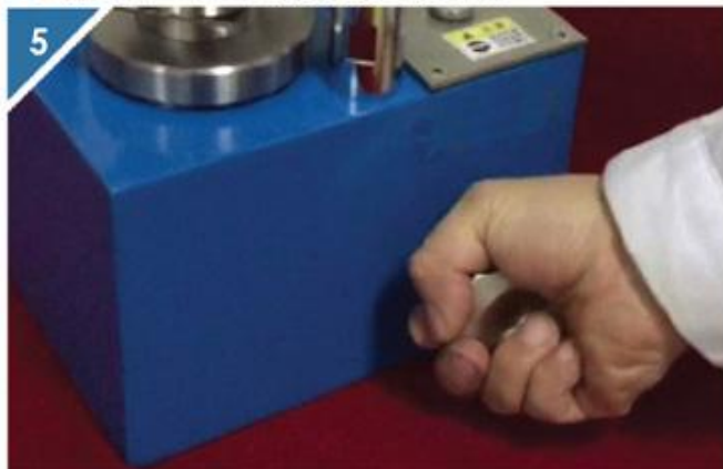
5 逆时针松开放油阀释放压力