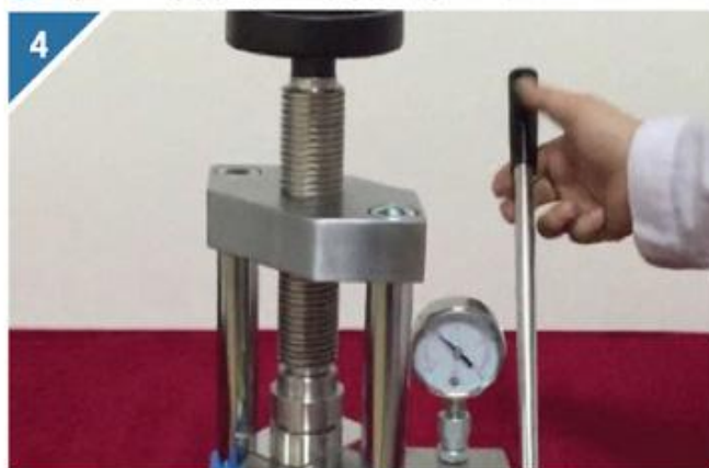
4 前后摇动手柄压杆达到所需压力